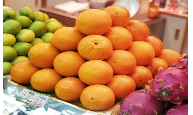
Figure T3 : Fruits stacked in a fruit stall

આકૃતિ T2 : જમીનના કણો વચ્ચેની છિદ્રોવાળી જગ્યા