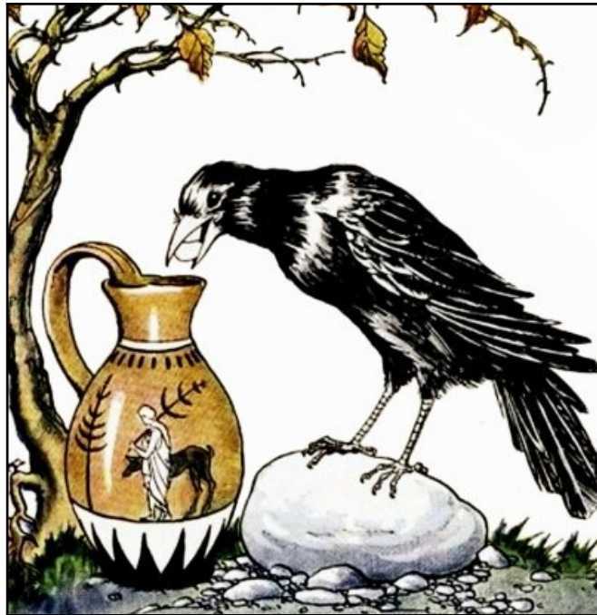
Figure 1 : The Crow and the Pitcher

શું તમને બાળપણમાં સાંભળેલી ‘તરસ્યા કાગડા’ની વાર્તા યાદ છે?(આકૃતિ 1 જુઓ) આ શૈક્ષણિક એકમમાં, આપણે વાર્તાના કાગડાનું અનુકરણ કરીશું. "જ્યારે કોઈપણ વસ્તુ પાણીમાં ડૂબી જાય છે ત્યારે તે પોતાના કદ સમાન માત્રામાં પાણીને વિસ્થાપિત કરે છે", આ સિદ્ધાન્તનો ઉપયોગ કરી આપણે કેટલાક માપ લઈશું. આ એકમનું છેલ્લું કાર્ય ‘તરસ્યા કાગડા’ની વાર્તાથી નિકટની સંબંધિત છે- અને તેના અંતમાં તમે એક આશ્ચર્યજનક નિષ્કર્ષ પર પહોંચી શકો છો.