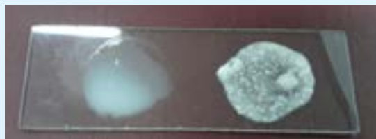
आकृती T1 दूध (डावीकडे) आणि दही (उजवीकडे) पसरवण्याच्या प्रयोगाचा एक विशिष्ट परिणाम. Figure T1 A typical outcome of the smudging experiment with milk (left) and curd (right).

The teacher can then ask if students know any other ways to differentiate. A possible answer could be the difference in smell, appearance, or consistency.