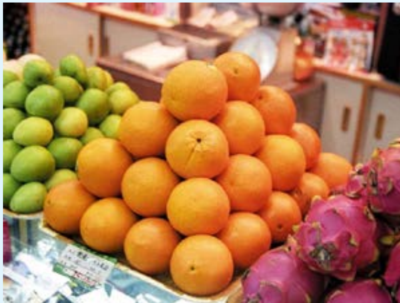
आकृती T3 फळांच्या दुकानामध्ये रचलेली फळे