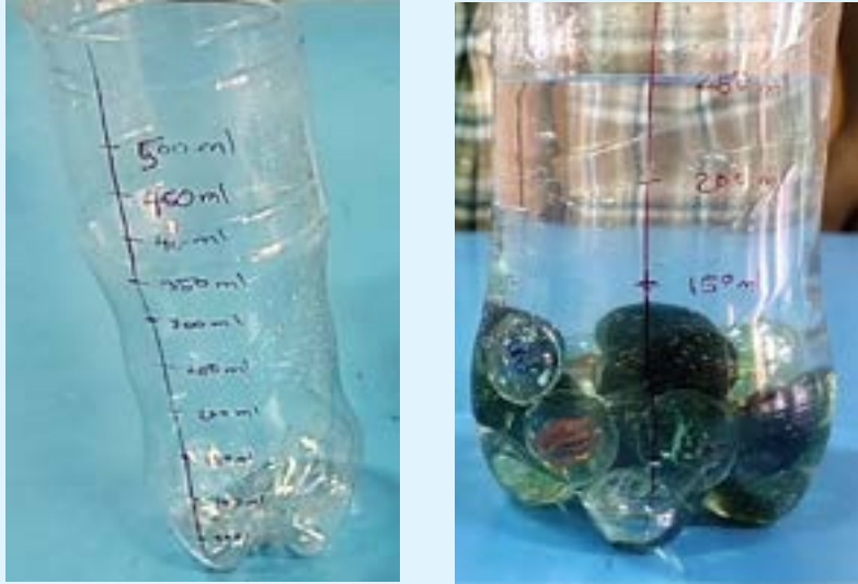
आकृती T1 (डावीकडे) मोजपात्र आणि (उजवीकडे) पाणी आणि गोटीया यांनी भरलेला मोजपात्र

When we performed this task, the result we obtained for the set of marbles that we had was about 50 mL for 25 marbles, which meant that the average volume of one marble was about 2 mL.