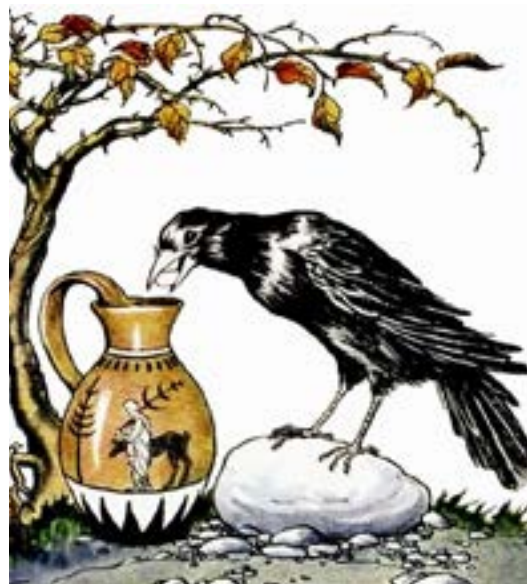
आकृती 1 कावळा आणि पाण्याची घागर Figure 1 The Crow and the Pitcher

Do you remember the childhood fable of the crow and the pitcher? (See figure 1.) In this unit, we will imitate the crow in the story and use the concept that 'a body submerged in water displaces an amount of water equivalent to its volume', to carry out some measurements. The last task in this unit is closely related to the tale — and you may reach a surprising conclusion at the end of it!