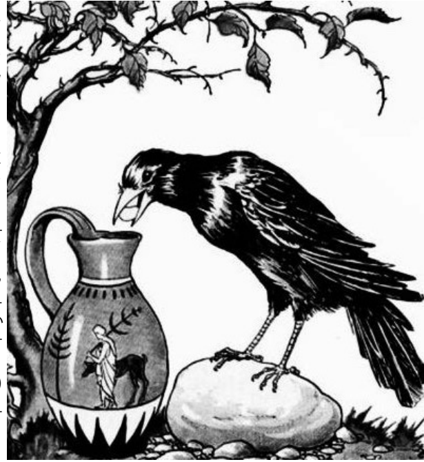
Figure 1: The Crow and the Pitcher आकृती 1: कावळा आणि पाण्याची घागर

तुमच्या लहानपणी एक तहानलेला कावळा आणि पाण्याच्या घागरीची गोष्ट तुम्ही ऐकलेली आठवते का? (आकृती 1 पहा). या अध्ययन घटकात, आपण गोष्टीतील कावळ्याच्या कृतीचे अनुकरण करून 'एखादी वस्तू पाण्यात टाकली असता वस्तू तिच्या आकारमानाइतके पाणी विस्थापित करते' हे तत्त्व वापरून काही मापने घेणार आहोत. शेवटची कृती (#5) आणि या दंतकथेचा जवळचा संबंध आहे — अध्ययन घटकाच्या शेवटी तुम्हाला एक आश्चर्यकारक निष्कर्ष मिळेल!