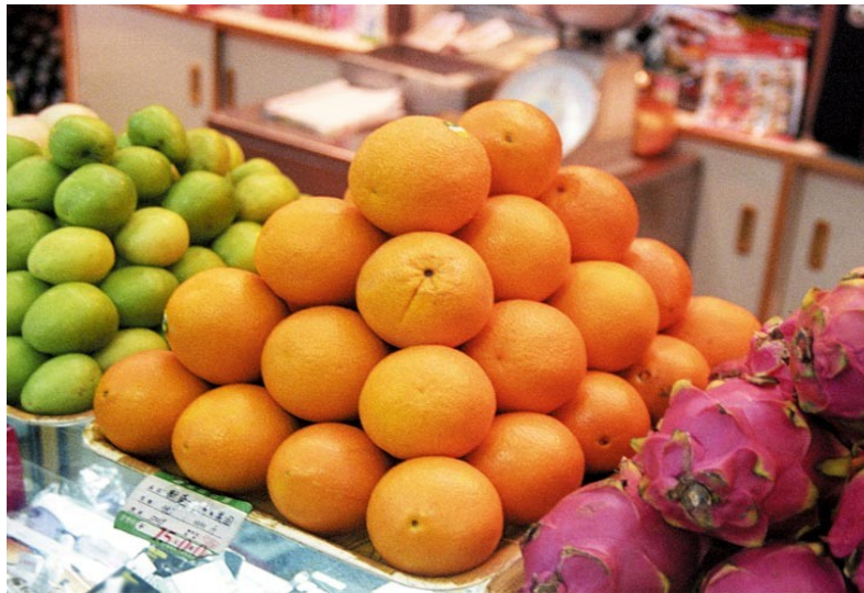
Figure T3: Fruits stacked in a fruit stall

पुढे दिलेल्या आकृती T3 मध्ये ‘षटकोनी बंदिस्त बंधन’ दाखवले आहे. बाजारात फळे किंवा चेंडू अशा प्रकारे मांडलेले तुम्ही पाहिले असतील.