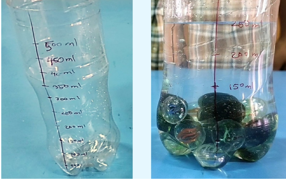
Figure T1: (Left) A measuring cylinder and (Right) A measuring cylinder with water and marbles

जेव्हा आम्ही ही कृती केली, तेव्हा 25 गोट्यांनी विस्थापित केलेले पाणी सुमारे 50 मिली. होते, म्हणजे एक गोटीचे सरासरी आकारमान सुमारे 2 मिली. होईल.